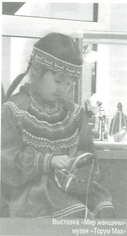
Выставка «Мир женщины» музея «Торум Маа»

Ресурсы библиотеки носят универсальный характер, а профиль музеев, с которыми нам приходится сотрудничать, разный. Взаимодействие с каждым происходит в соответствии с его