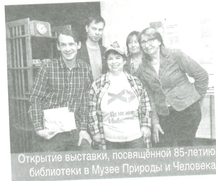
Открытие выставки, посвящённой 85-летию библиотеки в Музее Природы и Человека

Музей Природы и Человека участвует ещё в одном проекте Государственной библиотеки Югры: создание электронного ресурса «Ровесники округа: к 90-летию «Рыбокомбината Ханты-Мансийского», который будет включать цифровые копии документов (печатных, рукописных, фото, видео). В создании базы данных принимают участие также