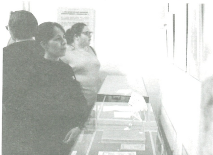
Выставка «120 лет библиотечному делу Югры» в Музее Природы и человека

Если говорить о совместных выставках, то стоит рассказать о недавнем опыте проведения библиотекой выездных выставок музейного типа.