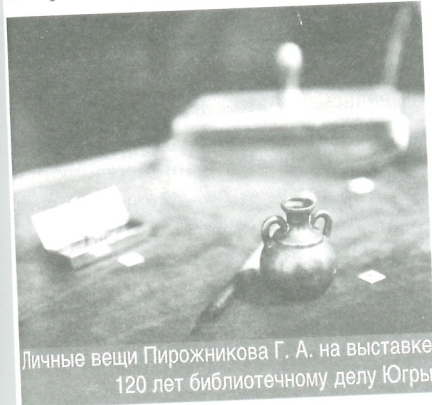
Личные вещи Пирожникова Г. А. на выставке 120 лет библиотечному делу Югры

На вернисажах всегда присутствовал художник, это дало возможность живого общения с ним. Чаще всего читающую публику интересовали мотивы его обращения к творчеству того или иного автора. Так мы узнали, что художе-