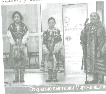
Открытие выставки Мир женщины

В Государственной библиотеке Югры ведётся реестр редких книг, хранящихся в фондах публичных библиотек округа, библиотек учреждений культуры и образования. В него входят редкие, рукописные и печатные изда-